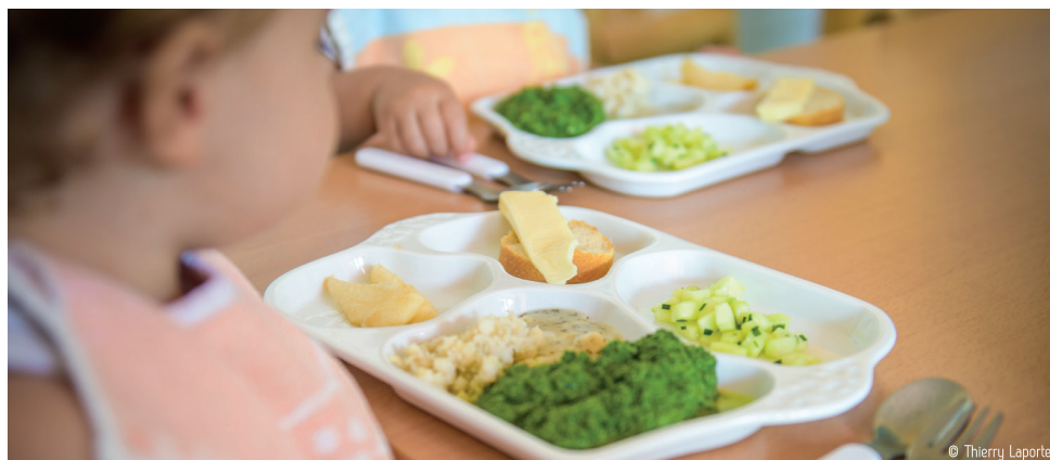
Plateaux repas en porcelaine utilisés dans les crèches municipales de Limoges.

Afin de limiter les risques toxiques liés au plastique, la Ville a remplacé les traditionnels plateaux repas par des plateaux en porcelaine.