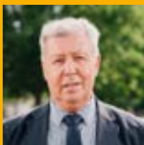
Jean-Philippe Ranquet Maire du Blanc-Mesnil