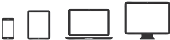
Une interface pour tous les écrans

Autre bénéfice, l'affichage s'adapte désormais à différents supports (écrans d'ordinateur, tablettes et smartphones).