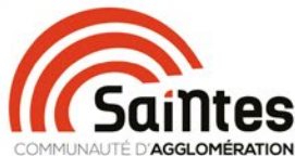
Illustration : Elsa de Saunier / C'est un plaisir / Adobe Stock / Freepress